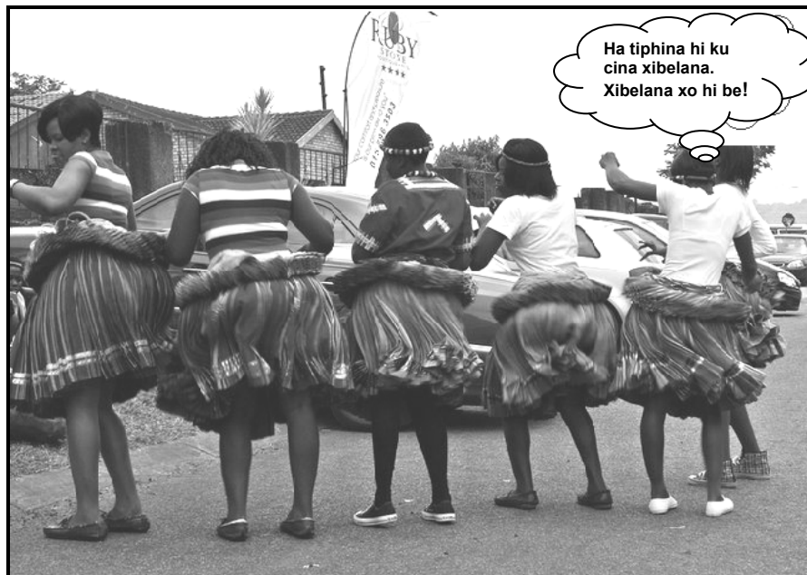
[Xifaniso xi huma eka www.google.co.za ]