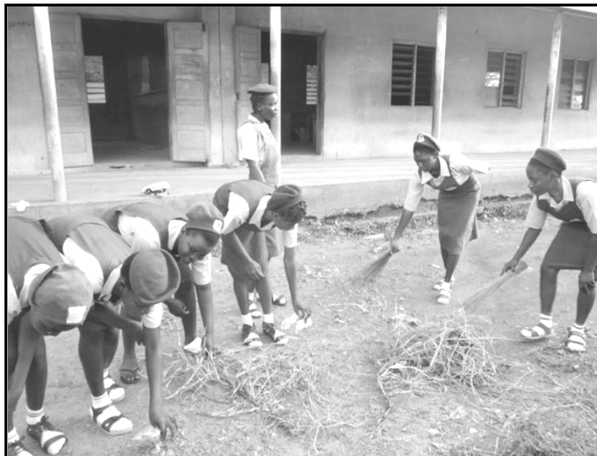
[E nopotswe go tswa mo inthaneteng]